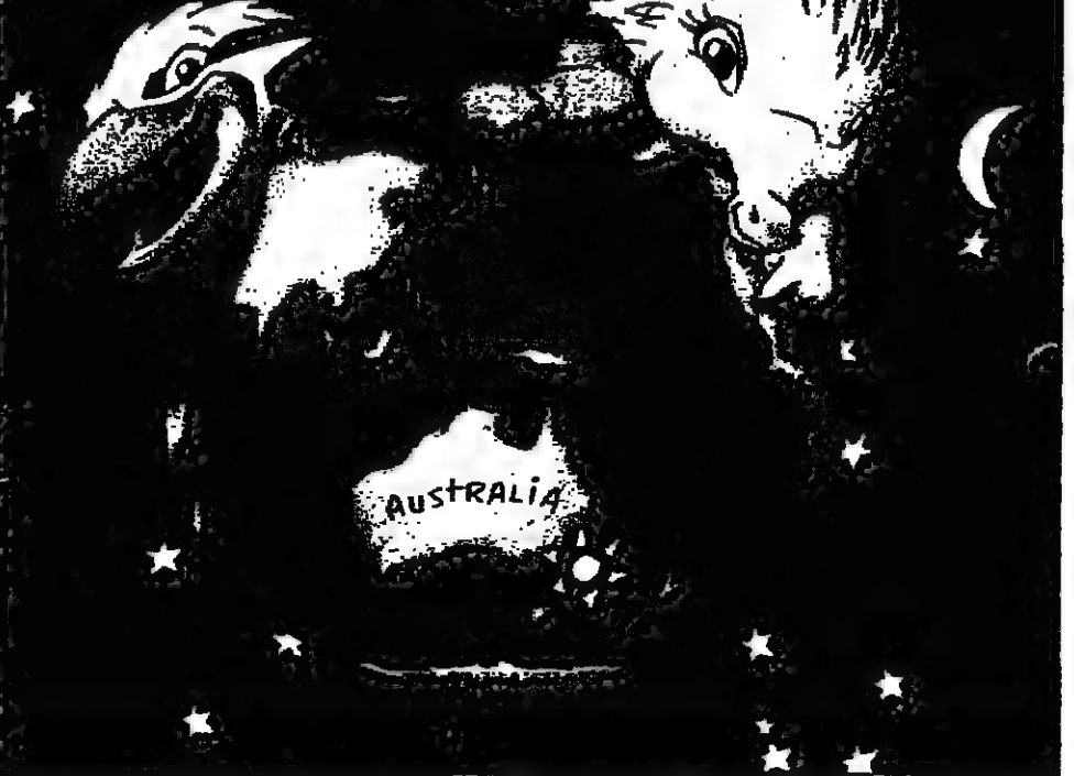
سيدني (استراليا) - ف. ب. - استلمت تعويذة دورة سيدني الالبية عام 2000 تسرا (أواللي) وحلدا ماثيا (سيد) وتفتنا (ميالي). وأوضح عضو للجنة الاسترالية للتلخنة مايكل دايت ان التعويذة تجمع بين الفرح والاولان (الاسندر والاحمر خصوصا) وتكس الصورة التي تريد سيدني ان تعطيها للدورة.